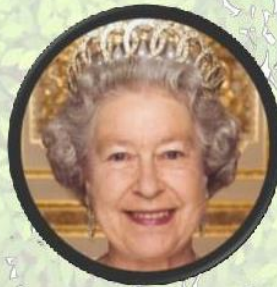
Queen Elizabeth II