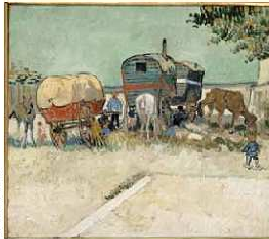
ILL.19 Vincent Van Gogh. Les roulottes, campement de bohémiens aux environs d'Arles. 1888. Paris, Musée d'Orsay